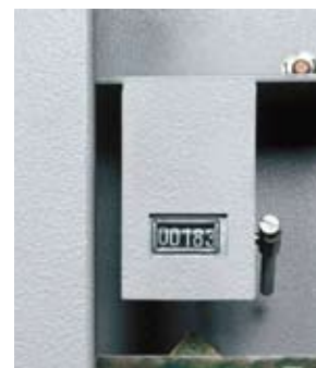
Le compteur et le scellé du foncet (en option): de précieux indices pour savoir si l'armoire a été ouverte en votre absence.