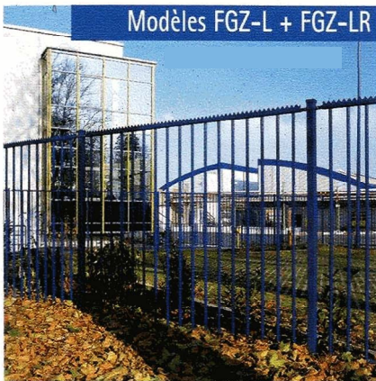
Modèles FGZ-L + FGZ-LR

La clôture FGZ, très facile à monter, se distingue par une très grande longévité et par une résistance exceptionnelle, et doit sa stabilité hors du commun à l'emploi de matériaux de très grande qualité et à des techniques de fixation modernes. Il est possible de réaliser des constructions spéciales en fonction du cahier des charges spécifique soumis par le client.