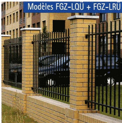
Modèles FGZ-LQÜ + FGZ-LRÜ

Contrairement au modèle FGZ, les clôtures barreaudées FGZ et FGZ-LR ne sont disponibles qu'avec des panneaux de largeur standard, qui peuvent cependant être très facilement ajustés sur place. La protection anti-franchissement peut être assurée par une lisse dentée.